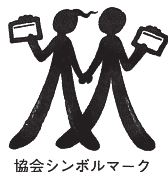
協会シンボルマーク